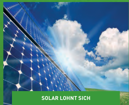
SOLAR LOHNT SICH