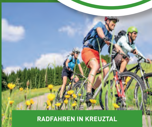
RADFAHREN IN KREUZTAL